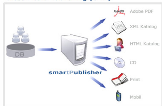
Cross Media Publishing (CMP)

Im Control Center, dem Herzstück des smart-Publishers werden sämtliche Publishing-Operationen gesteuert. Die Benutzeroberfläche orientiert sich an der, moderner Office-Anwendungen, ermöglicht ein sehr intuitives Arbeiten und damit einen minimalen Einarbeitungsaufwand.